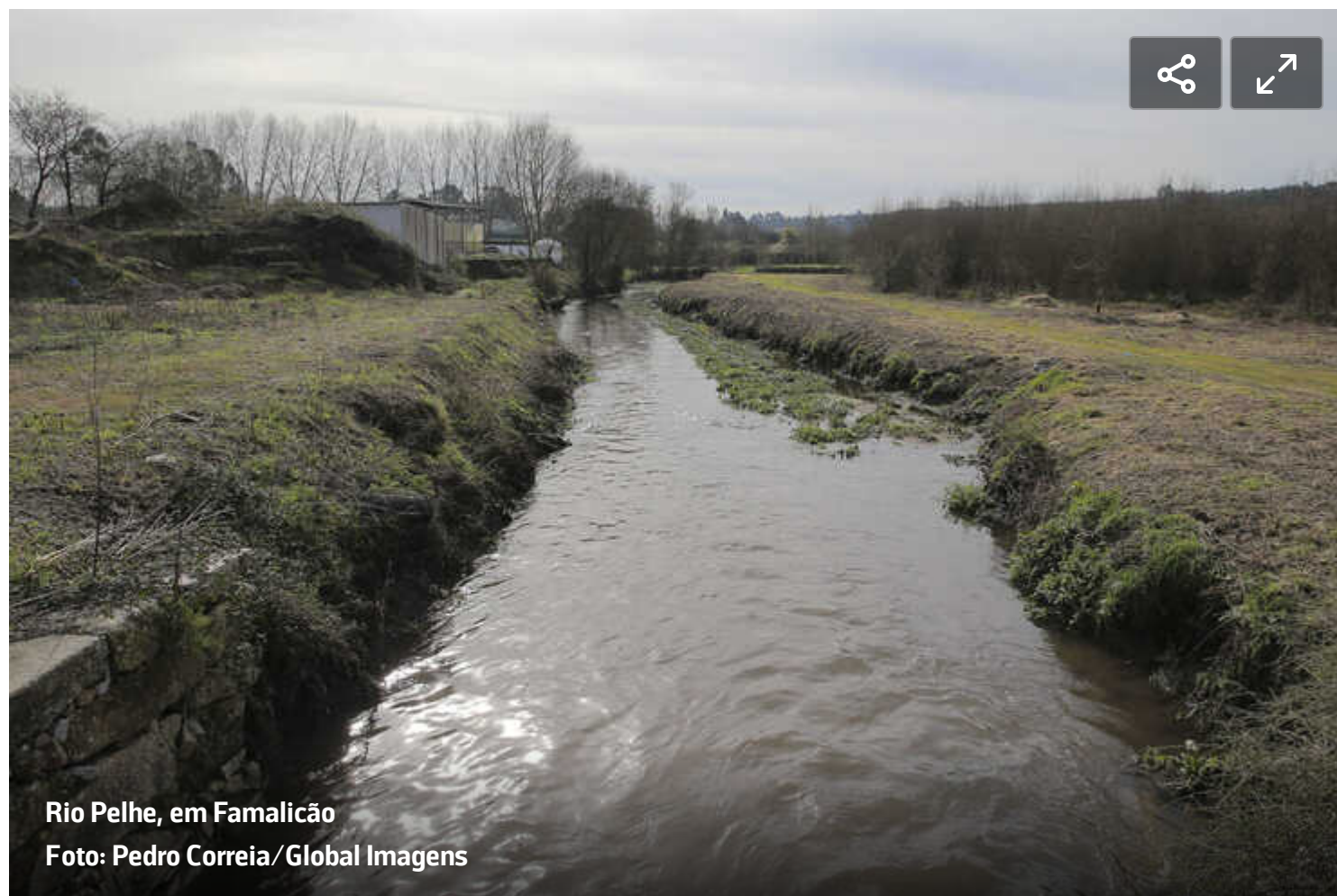
Rio Pelhe, em Famalicão

Arrancaram, esta segunda-feira, as obras de recuperação e valorização da Bacia Hidrográfica do Rio Ave em Famalicão. O projeto é financiado pelo Portugal 2020 em cerca de 1,2 milhões de euros e resulta de uma candidatura da Câmara de Famalicão em parceria com a Agência Portuguesa do Ambiente (APA).